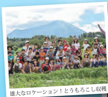
雄大なロケーション！とうもろこし収穫