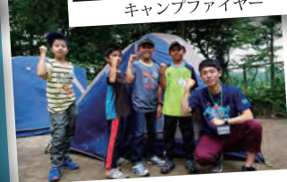
テントがたてられたよ！