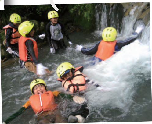
シャワークライミング