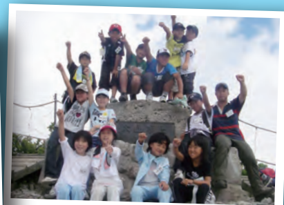
みんなで登ったよ大山登山