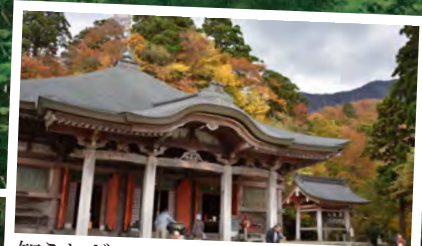
知られざる言い伝えとパワースポット