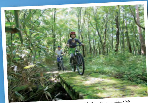
野鳥や動物しか訪れない古道