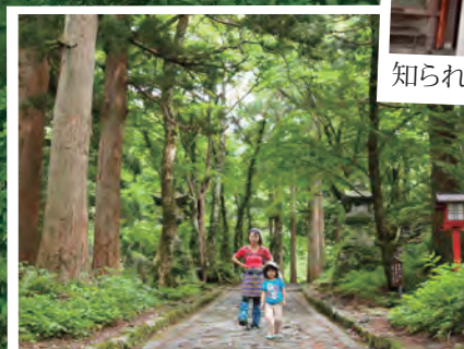
自然に親しみ歴史をたずねる スピリチュアルウォーク