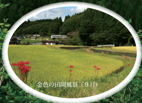
金色の田園風景 (9月)