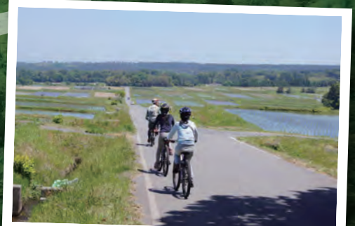
今はもう車の走っていない田舎道